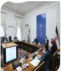
گروه بانک، بیمه و بورس – بررسی‌ها نشان می‌دهد فقدان زیرساخت حقوقی و ذات شفافیت‌گریز پدیده ارزهای دیجیتال، کار را برای احقاق حقوق مالباختگان و شاکیان پرونده‌های رمزارز تقریباً ناممکن کرده است.

به گزارش اقتصادسراسرآمد، با سرایت وپروس کرونا به اقتصادهای بزرگ جهان، توجه به سرمایه‌گذاری در بازارهایی نظیر طلا و رمزارز شدت گرفته است. تا جایی که هر اونس جهانی طلا در مرداد سال گذشته به ۲۰۶۰ دلار رسید و بیت‌کوین هم اخیراً تا قله ۶۴ هزار دلاری بالا آمد و اخیراً در محدوده ۵۰ هزار دلاری نوسان می‌کند. درگزارش مهرآمده است: سال‌های اخیر در ایران نیز موج جدیدی از سرمایه‌گذاری در بازار رمزارزها شکل گرفته که نسبت به آن بیم و امیدهایی وجود دارد. شاید مهم‌ترین دلیل استقبال مردم کشورمان از بازار رمزارزها، بهره‌مندی از افزایش نرخ ارز و افزایش قیمت جهانی رمزارزها باشد؛ اتفاقی که ناشی از ارزش‌گذاری لاری رمزارزهایی مانند بیت‌کوین است.