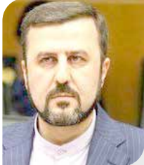
گروه جامعه - سال ۹۶ بود که اعضای

شورای شهر پنجم پس از کسب رای به پارلمان شهری راه یافتند و برنامه ای را تدوین کردند که بر مبنای آن و در قالب یک برنامه ۶۶ صفحه‌ای، «نقشه‌بازسازی پایتخت» را برای تبدیل شهر تهران از «شهر مبذل شده به کارگاه عمرانی» به «شهر سالم برای سکونت» ارائه کردند. در قالب این طرح که حاوی مهم‌ترین برنامه‌های پیش‌بینی شده اعضای شورای شهر در طول چهار سال دوره پنجم مدیریت شهری بود قرار بود رزمیه تصفیه ساختار نیمه زنده شهر از مولفه‌های مزاحم رفاه و آرامش شهروندان را فراهم شود تا به این ترتیب در سال پایانی دوره پنجم مدیریت شهری یعنی سال ۱۴۰۰، تصویر پایتخت از یک شهر خاکستری و سیاه در ذهن شهروندان به یک شهر سبز و قابل سکونت تغییر کند ودیدیم که نشد. به نوبه جزئیات محورهای کاری این برنامه نشان می‌دهد