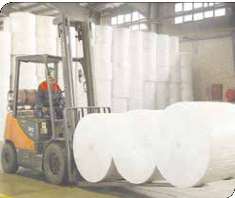
کاغذ و قیمت‌های بالای حاکم بر آن همچنان پابرجاست.

ماراتن ارشاد و دلانن کاغذ برای قیمت گذاری